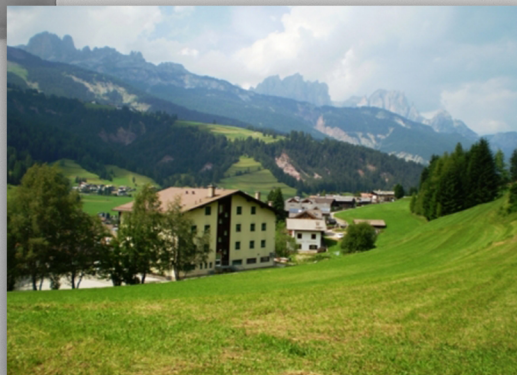
Vista dell'Hotel Ombretta, Soraga di Fassa(TN)