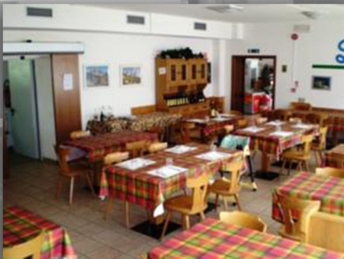
Hotel Ombretta, Soraga di Fassa(TN)