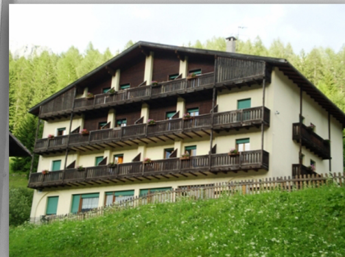
Hotel Ombretta, Soraga di Fassa(TN)