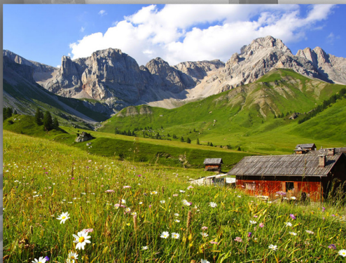
Val di Fassa, Trentino Alto Adige